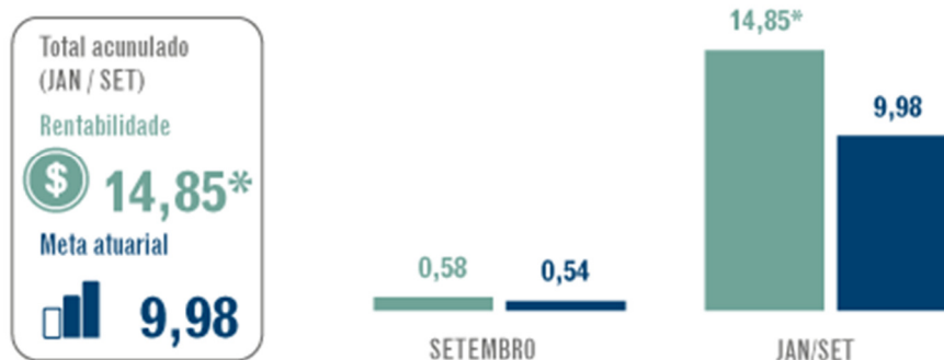
Rentabilidade do plano X Meta atuarial – em percentual (%)

*A rentabilidade total do plano é o retorno dos investimentos, descontados outros fatores que interferem no resultado, como por exemplo, despesas de custeio administrativo.